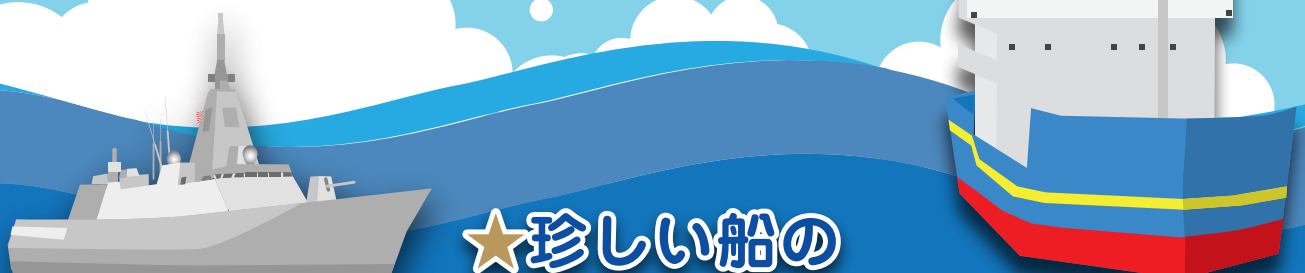
●海上自衛隊 護衛艦「むらさめ」

東京みなと祭運営事務局 03-5379-1336 minato@id-corp.co.jp (平日10:00~17:00)