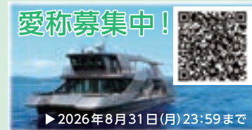
②東京都港湾局ブースで募集中