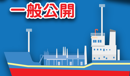
●東京都港湾局 しゅんせつ船「海竜」