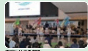
東京消防庁音楽隊

会場内5か所(★)に設置している問題を解いて素敵なグッズをもらおう! さらにアンケートに答えるとポर्टステージで行う抽選会に参加できます。 抽選会では、ランチクルーズなど豪華景品を用意しています。参加は右の二次元コードからスマホで。または1F総合案内所で配布する用紙でも可能です。